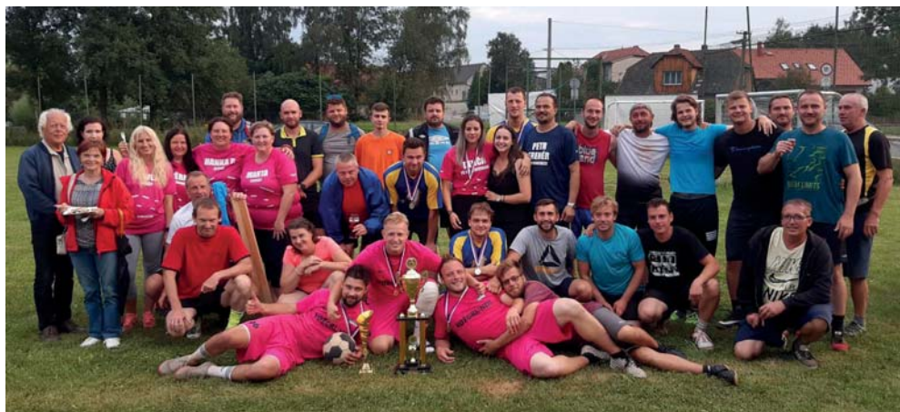
Foto z turnaje z roku 2020

Pro zúčastněné je zajištěno mnoho pěkných cen, pro všechny pak občerstvení.