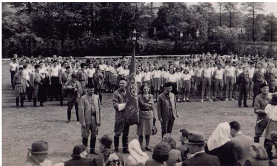
Nastoupení cvičenci za sokolovnou v místech, kde jsou nyní tenisové kurty

Pozorný čtenář si jistě všiml, že v květnovém zpravodaji v článku o historii Sokola byla nedopatřením otištěna fotografie, která neodpovídala popisku. Pod druhou fotografií (na str. 6) mělo být napsáno, že cvičenci pochodují kolem základní školy. Takže správné foto s původním popiskem otiskujeme zde: