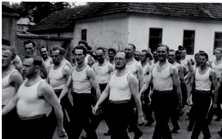
Nastoupení cvičenci za sokolovnou v místech, kde jsou nyní tenisové kurty.