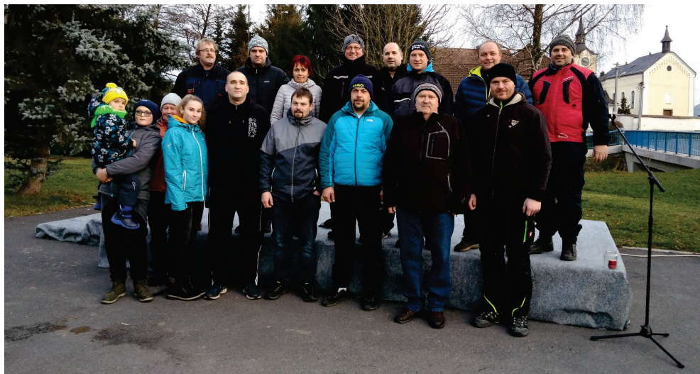
Foto z příprav na rozsvícení vánočního stromu