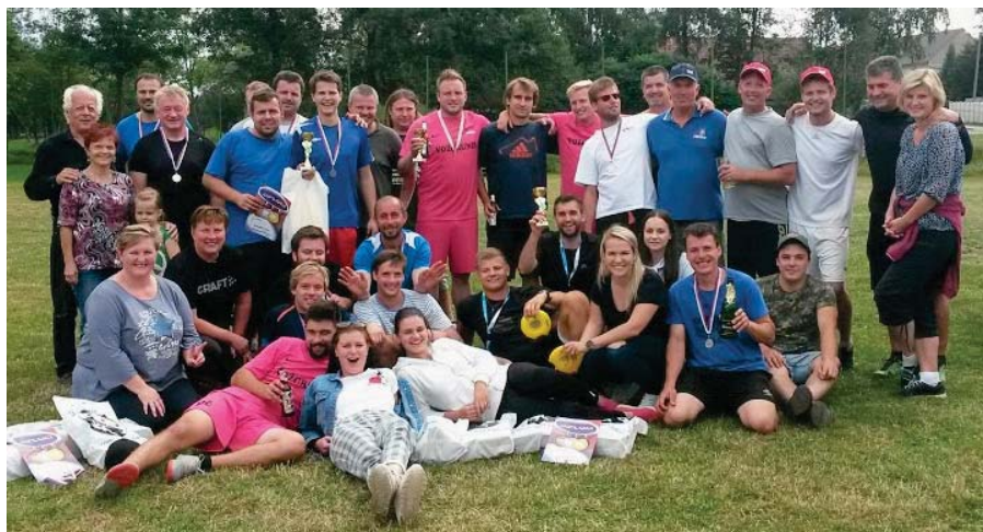
Společná fotografie účastníků a pořadatelů