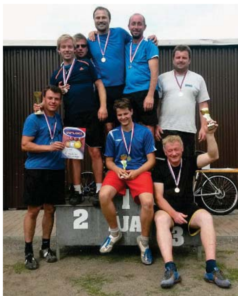
První tři místa v turnaji