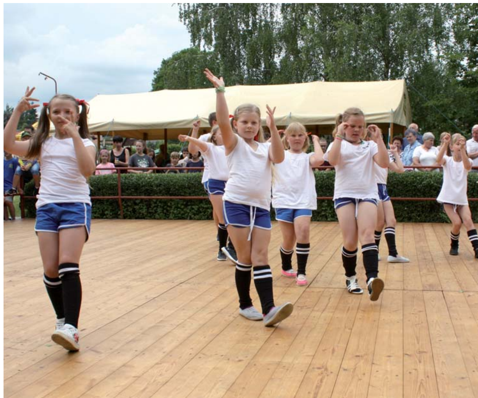
Vystoupení dětí tanečního kroužku při Základní škole Ostrov nad Oslavou v rámci Dne městyse