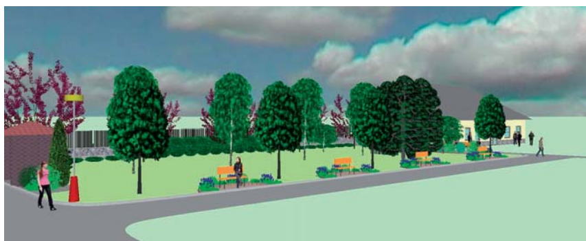
Pohled od kříže