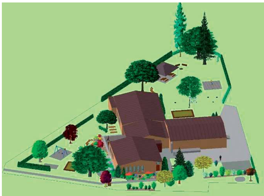
Celkový pohled na zahradu MŠ

Projekt na úpravu zahrady místní mateřské školy: