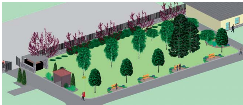
Celkový pohled na upravovanou plochu

Běžná údržba zeleně bude prováděna zaměstnanci městyse. Ořez korun stromů v budoucích letech bude prováděn odborníkem.