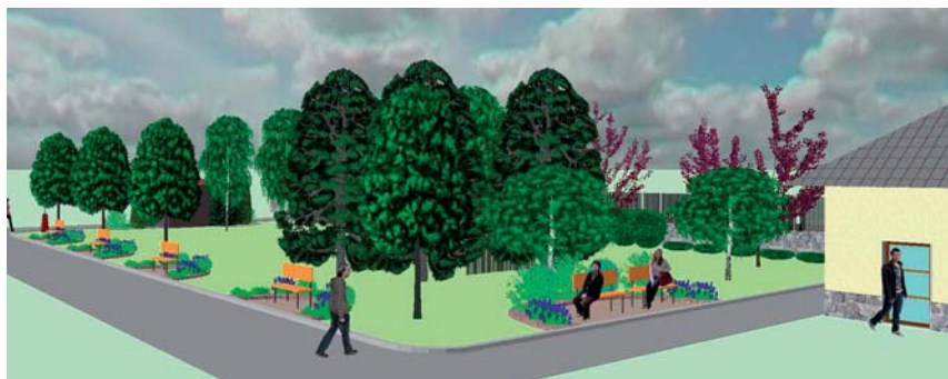
Pohled od smuteční síně